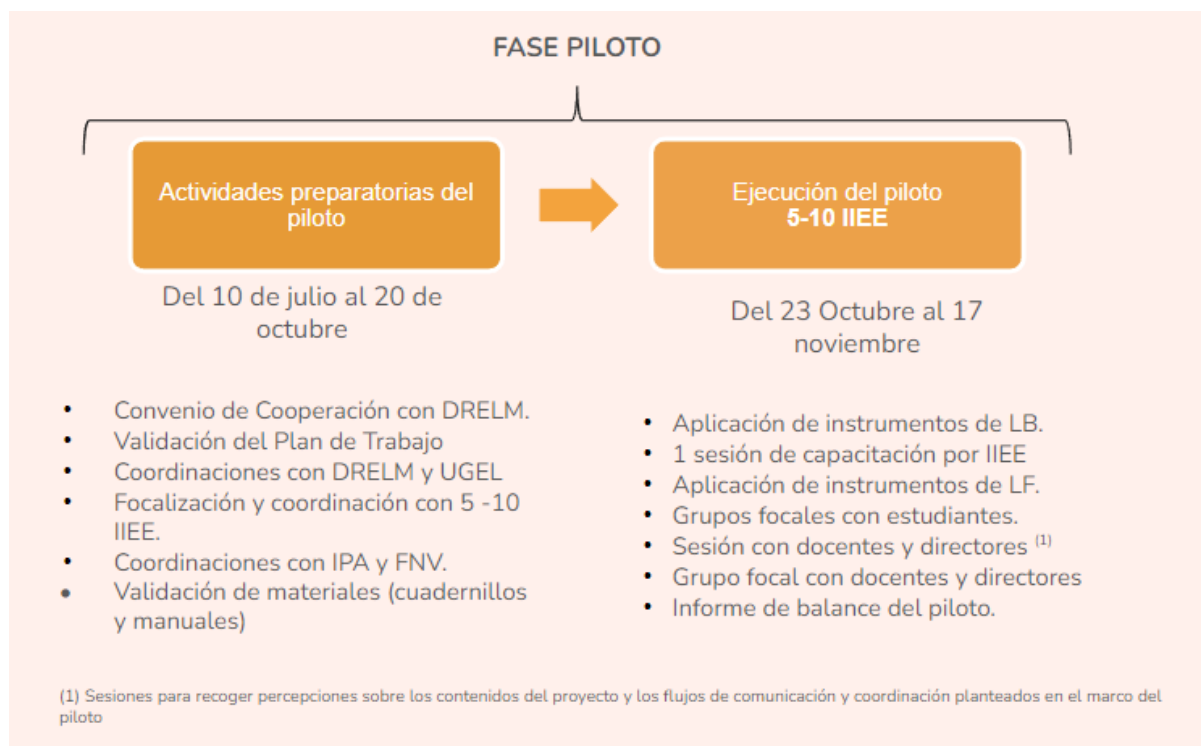
Figura 1: Actividades Programa Piloto